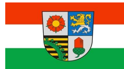
Landkreis Altenburger Land